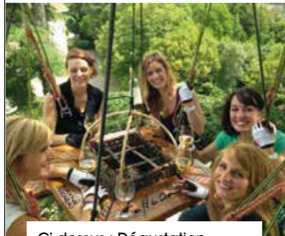
Ci-dessus : Dégustation perchée au Château Rayne-Vigneau. Ci-dessous : L'élégance d'un déjeuner privé au Château Haut-Bailly.