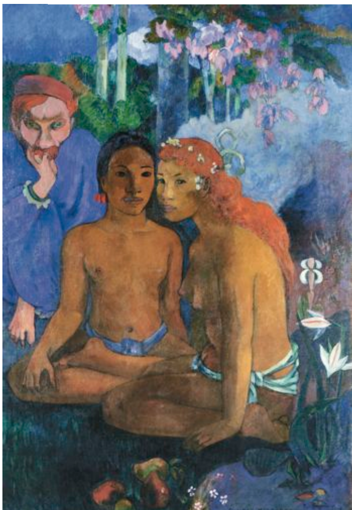
« Contes Barbares », de Paul Gauguin (1902).