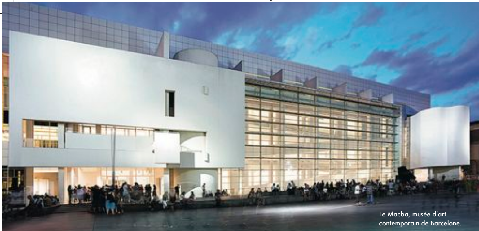
Le Macba, musée d'art contemporain de Barcelone.