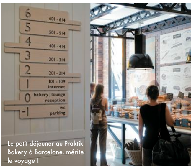
Le petit-déjeuner au Praktik Bakery à Barcelone, mérite le voyage !