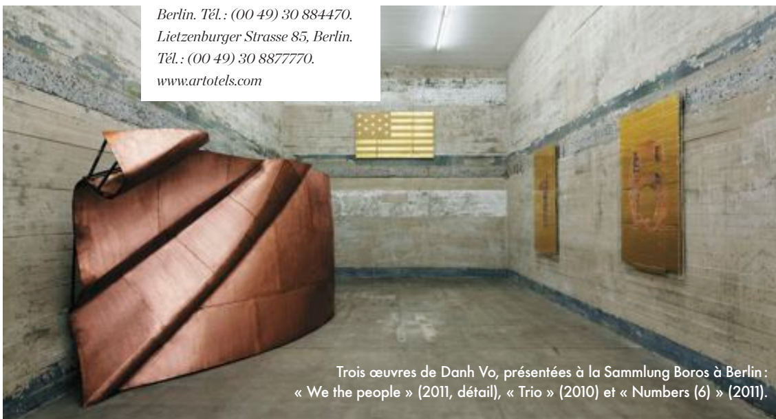
Trois œuvres de Danh Vo, présentées à la Sammlung Boros à Berlin : « We the people » (2011, détail), « Trio » (2010) et « Numbers (6) » (2011).