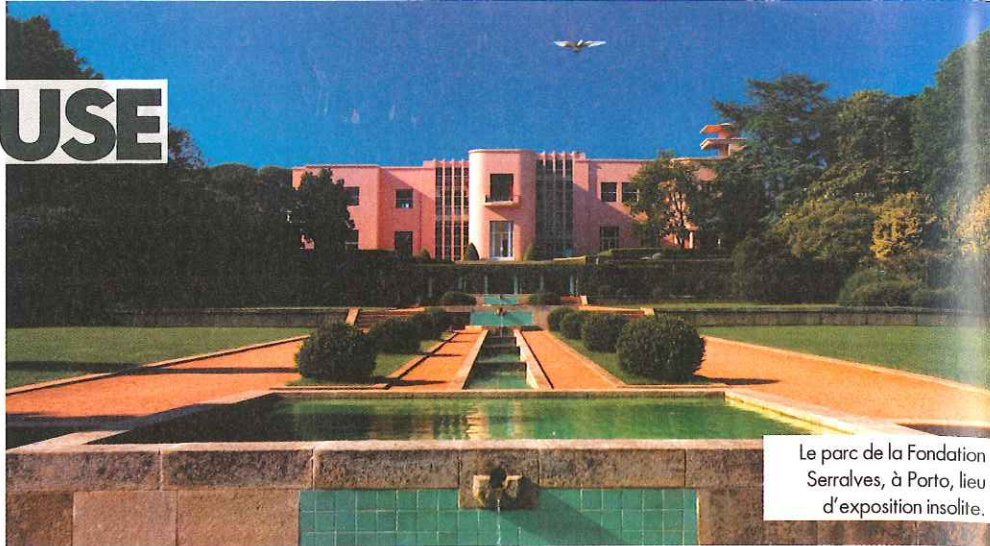
Le parc de la Fondation Serralves, à Porto, lieu d'exposition insolite.