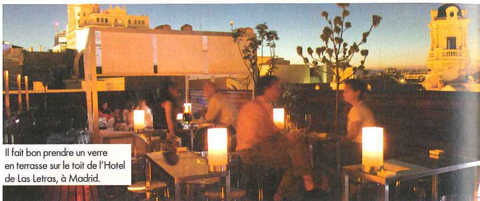
Il fait bon prendre un verre en terrasse sur le toit de l'Hotel de Las Letras, à Madrid.