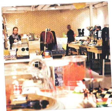
A Amsterdam, on déniché de jolis objets déco chez Options!