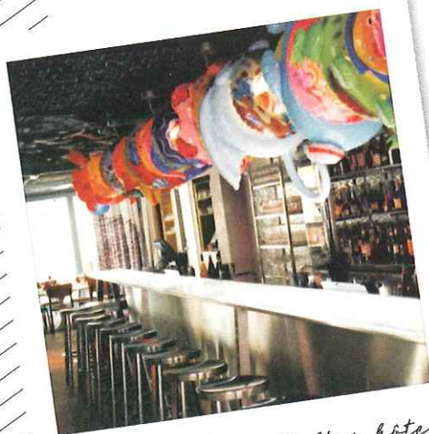
Ce bar du Mama Shelter, hôtel haut en couleur de Marseille.