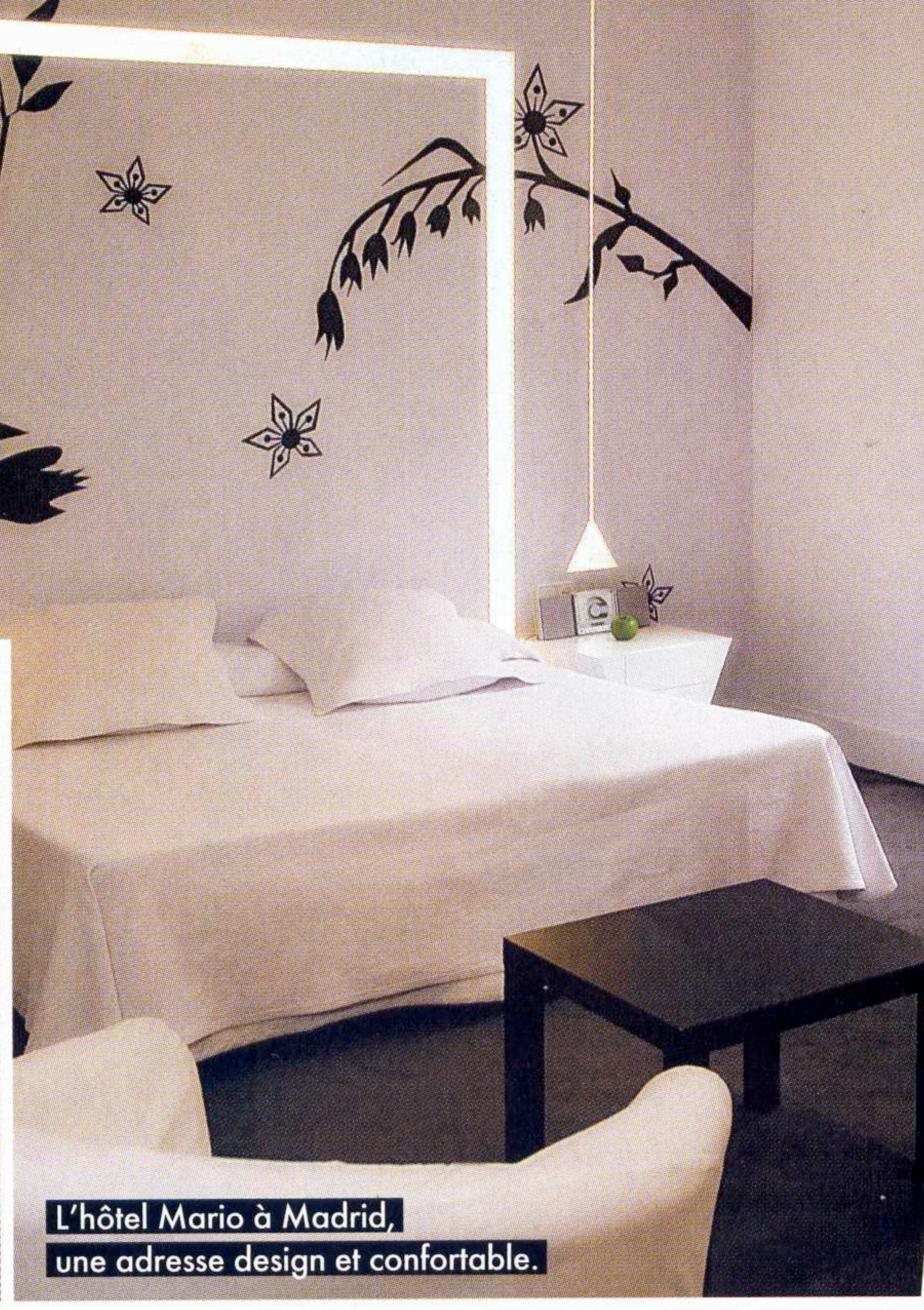
L'hôtel Mario à Madrid, une adresse design et confortable.

■ Avenida da Liberdade 177A, 1 er étage. Tél. : +351 213 256 736.