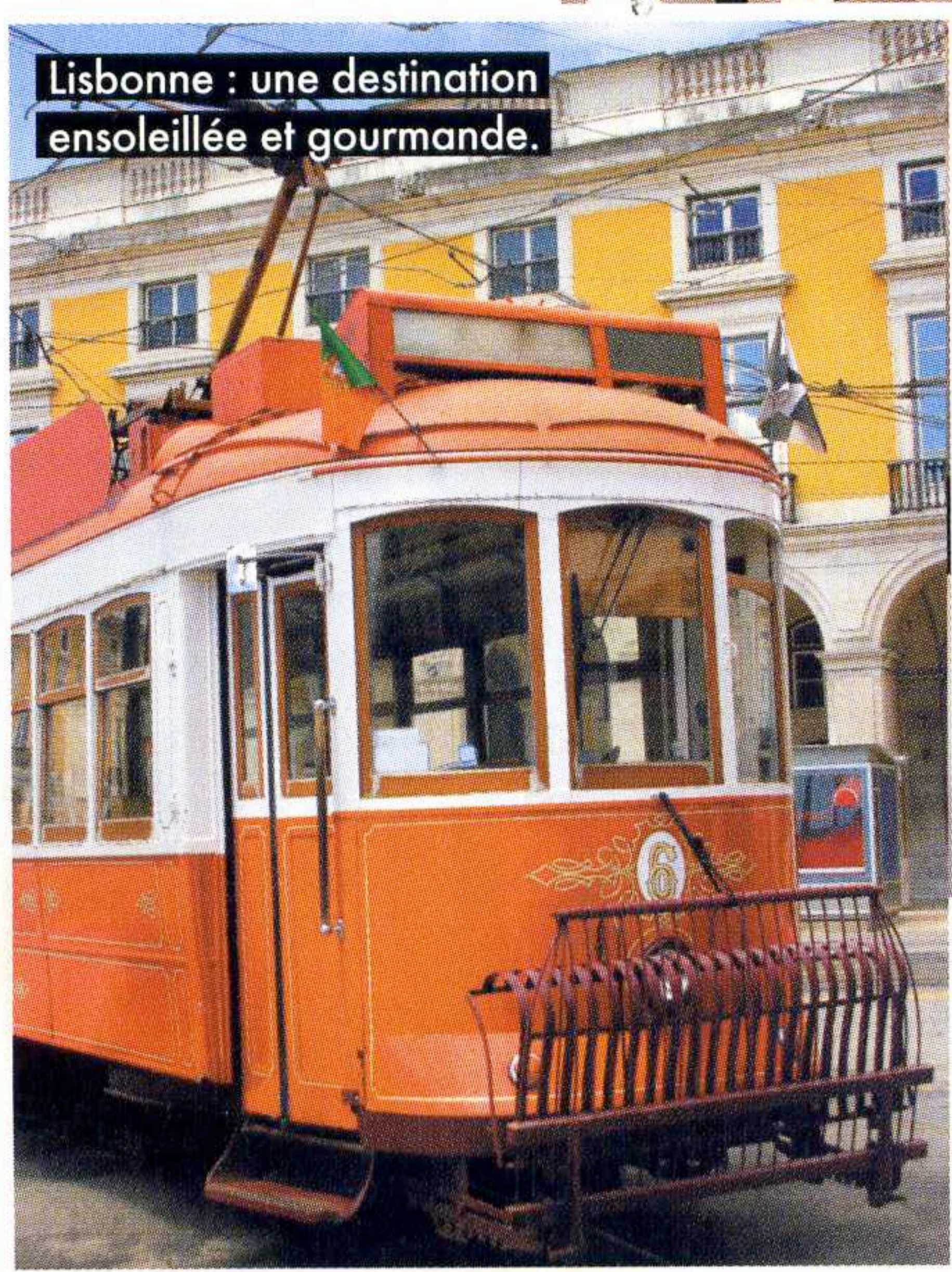
Lisbonne : une destination ensoleillée et gourmande.