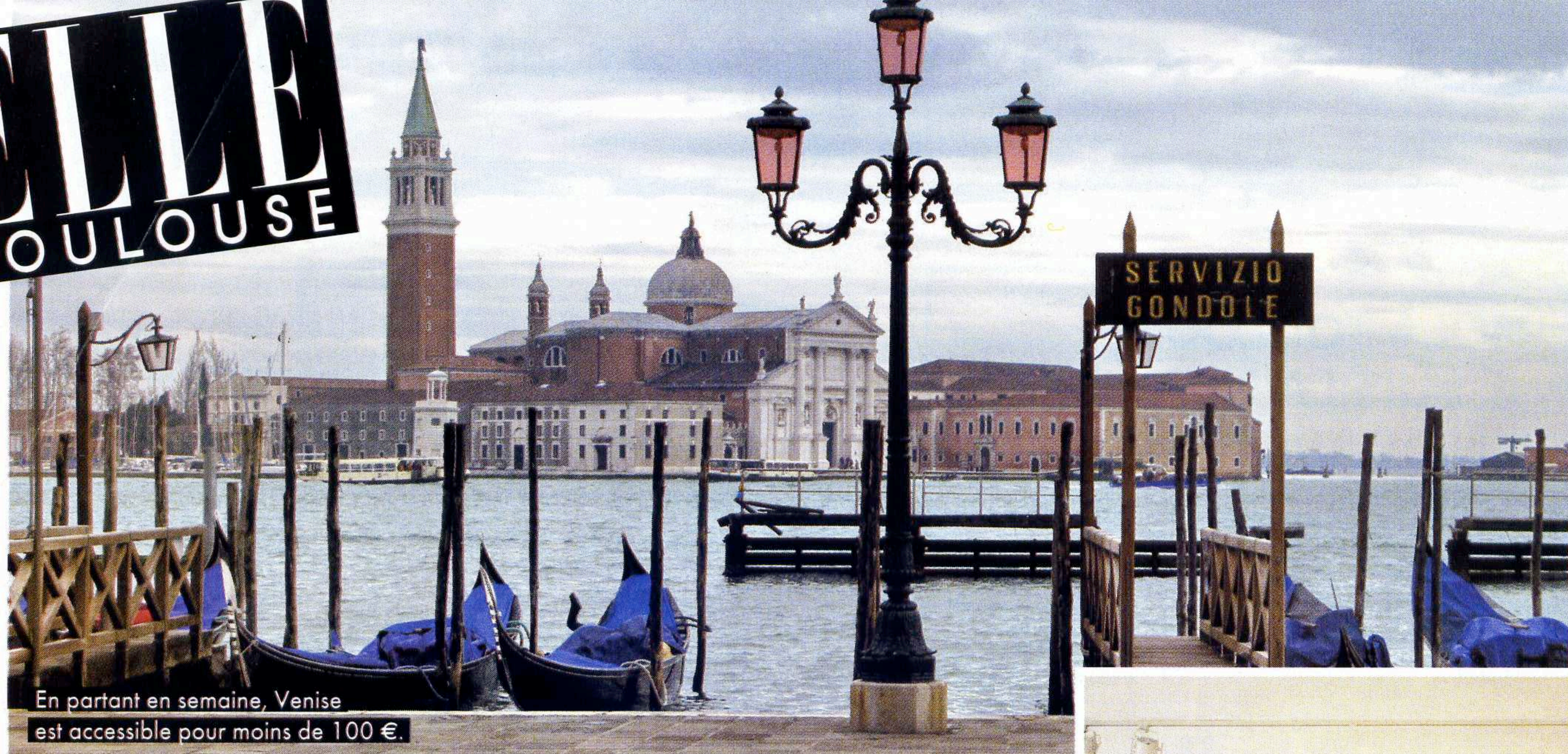
En partant en semaine, Venise est accessible pour moins de 100 €.