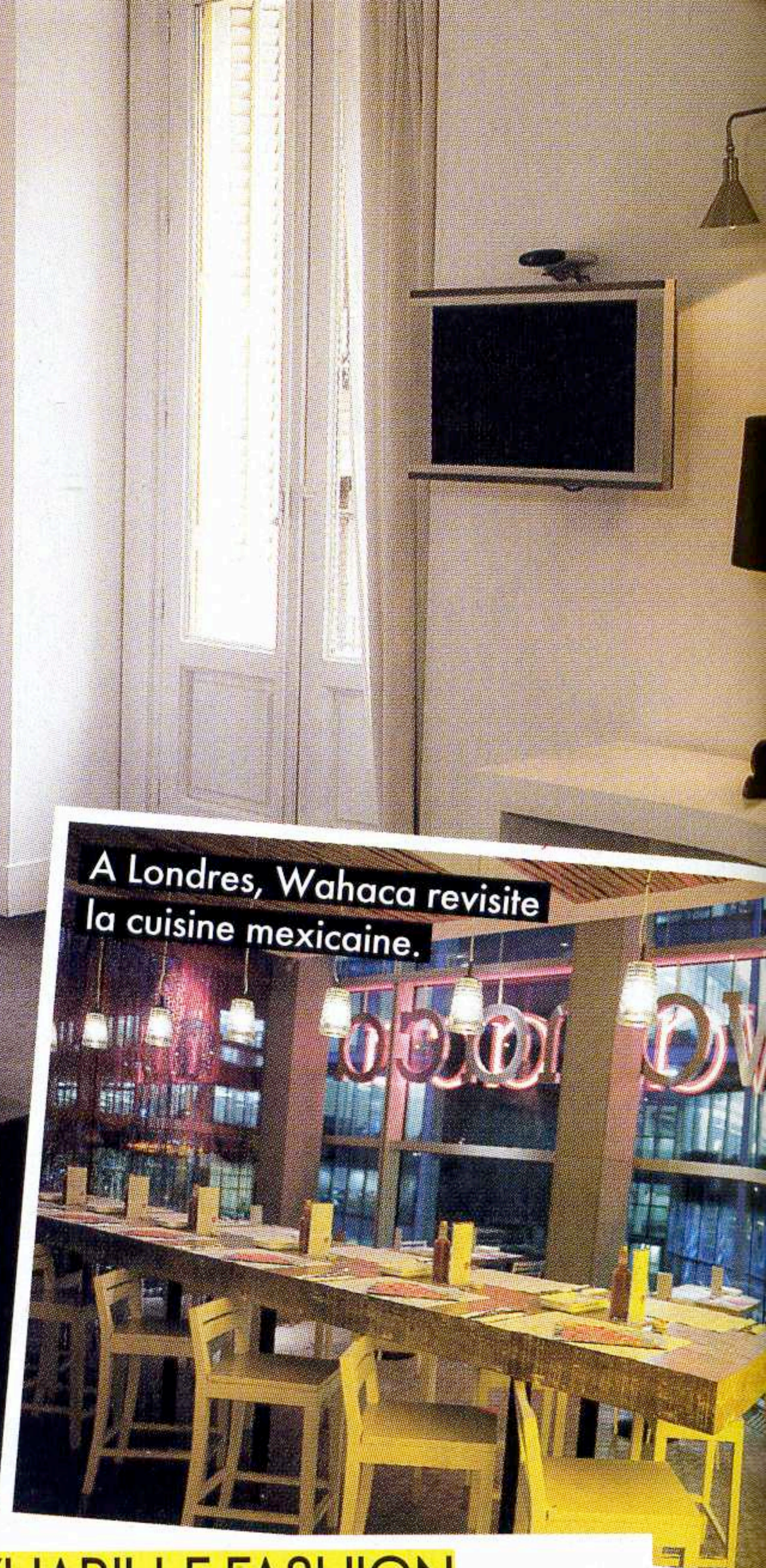
A Londres, Wahaca revisite la cuisine mexicaine.

■ Infantas 19, barrio de Chueca. Tél. : +34 902 876 136. www.isolee.com